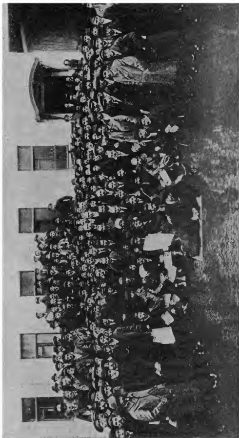
III Петроградская обшегородская конференция фабрично-заводских комитетов (10 сентября 1917 г.).