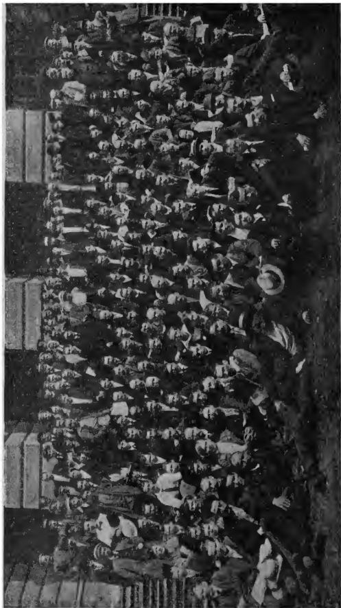
II Петроградская общегородская конференция фабрично-заводских комитетов (7—12 августа 1917 г.).