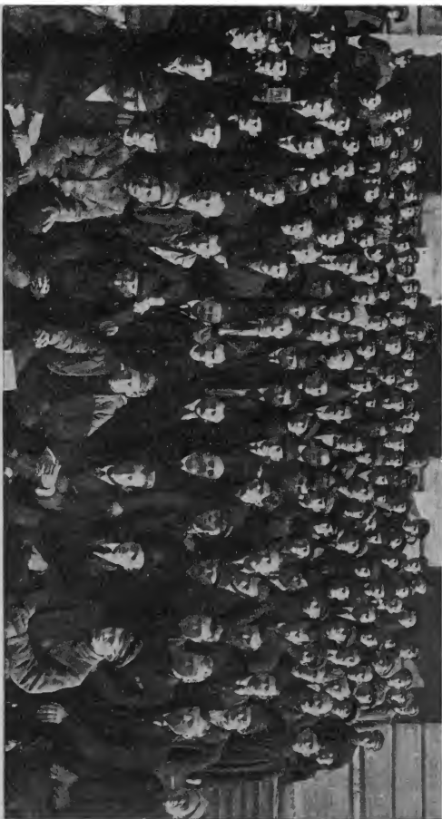
I Всероссийская конференция фабрично-заводских комитетов (17—22 октября 1917 г.).